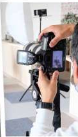
スマホ 一枚をゼビ!

自分らしい装いでOK! お一人でもご夫婦でも 気軽に撮影できます ※ヘアメイクはありません