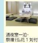
通夜室一泊・ 祭壇(仏花1対付)