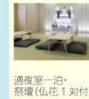
通夜室一泊・ 祭壇(仏花1対付)